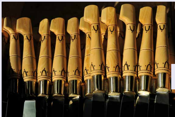
Couteaux de Nontron.

Quatre couleurs définissent la région Périgord : le pourpre pour le vin avec la ville de Bergerac ; le noir pour la truffe ( tuber melanosporum ) avec la ville de Sarlat ; le vert pour ses forêts de châtaigniers avec ses villes de Brantôme (la Venise du Périgord) et Nontron (capitale du couteau) ; le blanc pour le calcaire (carrières, causses et pelouses sèches) avec la ville de Périgueux.