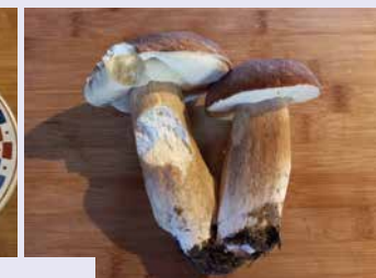
Truffe, foie gras et cèpes de la région...