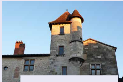
Maison du pâtissier à Périgueux.