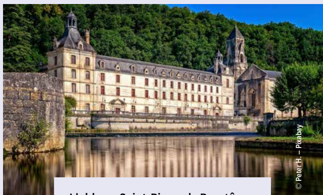
L'abbaye Saint-Pierre de Brantôme.

Ces activités ainsi que les modalités d'inscription seront détaillées dans un bulletin qui sera mis en ligne sur le site de la Fnosad (fnosad.com), sur le site du GDSA de la Dordogne (gdsadordogne.fr) et dans le prochain numéro de votre revue ( La Santé de l'Abeille n°316) à paraître fin juillet-début août.