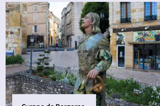
Cyrano de Bergerac.